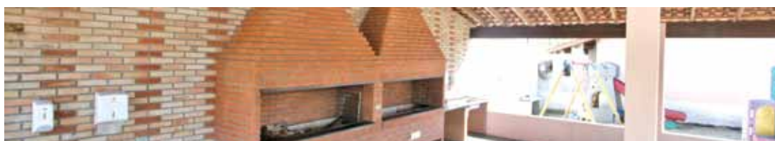
Colônia de Férias de Caraguatatuba