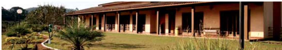
Centro Campestre/Pesqueiro de Ibiúna