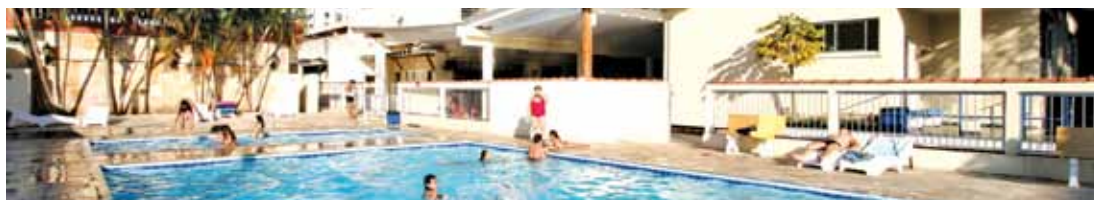
Colônia de Férias de Praia Grande